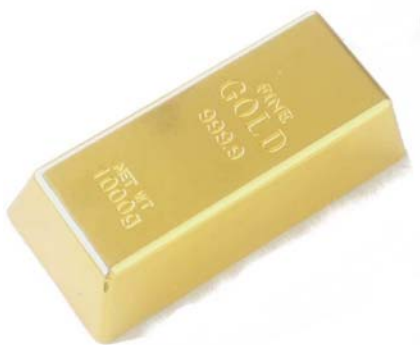
Рисунок 3. Сильноточный бескорпусной байпассер из золота.