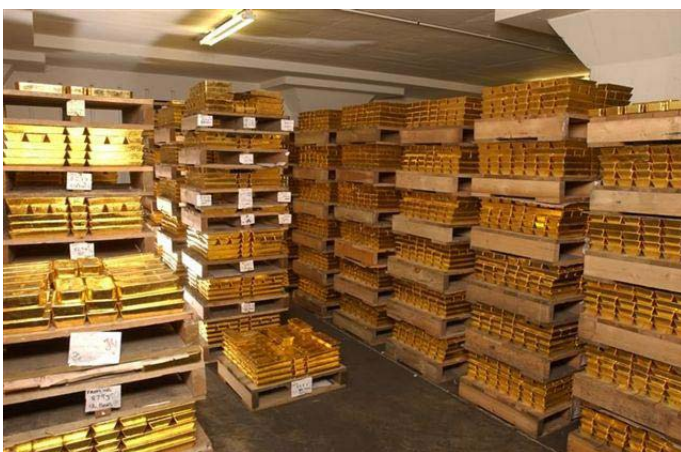
Рисунок 5. Склад фирмы ByPassInc, где находятся сильноточные бескорпусные байпасеры.

При этом, благодаря отлаженному производству фирма ByPassInc занимает лидирующее место в мире по производству бескорпусных байпасеров. На рисунке 5 показан склад фирмы, где находятся сильноточные бескорпусные байпасеры.