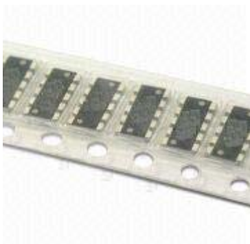
Рисунок 2. Упаковка 5-ти канальных байпассеров в ленту.

Наличие широкой линейки корпусных решений позволяет пользователю реально выбрать требуемый тип байпассера. А поскольку внутри микросхемы байпассера применена патентованная технология восьмислойного меднения, то микросхема не требует вентиляторов, а это реально повышает надежность такого решения для всех линеек обвязки.