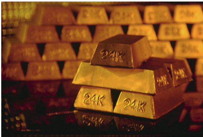
Рисунок 4. На корпусе сильноточных бескорпусных байпасеров нанесена маркировка «24K».

Линейки байпасеров имеют одинаковые практические характеристики, но отличаются только током пропускания. Так же, по требованию заказчика, на боковые поверхности байпасера может быть нанесена дополнительная маркировка и любая другая рекламная информация. На рисунке 4 показано, что на корпусе сильноточных бескорпусных байпасеров по требованию заказчика нанесена маркировка «24K».